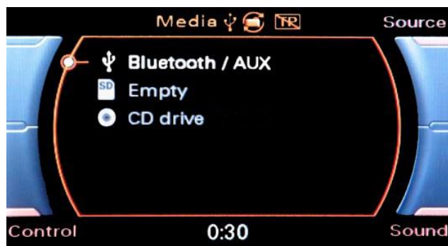
Media oversigt med Bluetooth

Start afspilning af musik fra telefonen, og brug herefter radioens FREM/TILBAGE/FF/RW (3) knapper til at styre musik. I radioens display vises ID3 tags med Titel/Artist/Album.