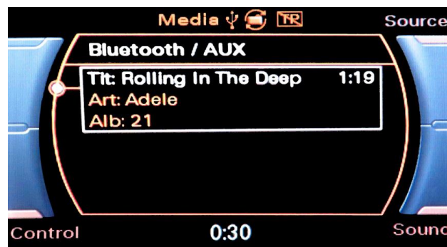
Titel/Artist/Album vises i display